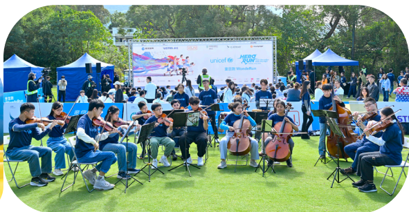
「童您跑」活動糅合情緒健康、運動、親子和教育元素，散播愛與關懷。