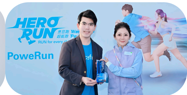
國際著名鋼琴家沈靖韜先生獲委任為 UNICEF HK 大使。