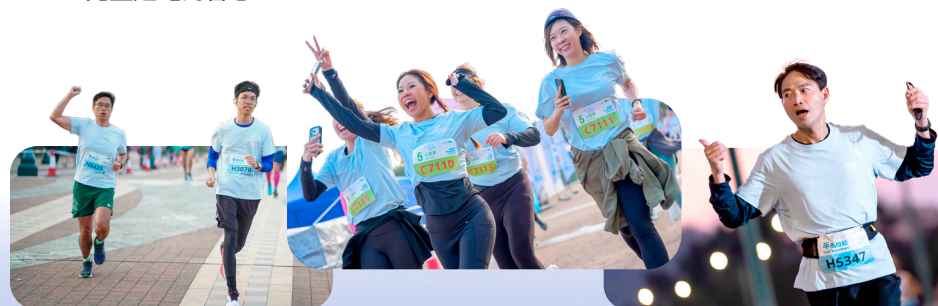
跑手們步伐不同，但目標一致，皆為SDG 4：優質教育而跑。