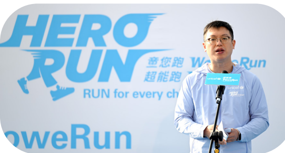
勞工及福利局副局長何啟明先生指政府非常重視兒童福祉，並讚揚參加者以行動為弱勢兒童起跑的善心。