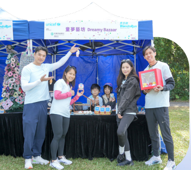
小朋友在家長帶領下化身「童夢藝坊」小檔主，實踐兒童幫助兒童的精神。